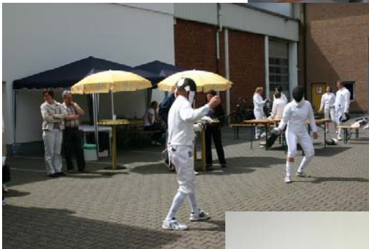
Austausch mit Gouda